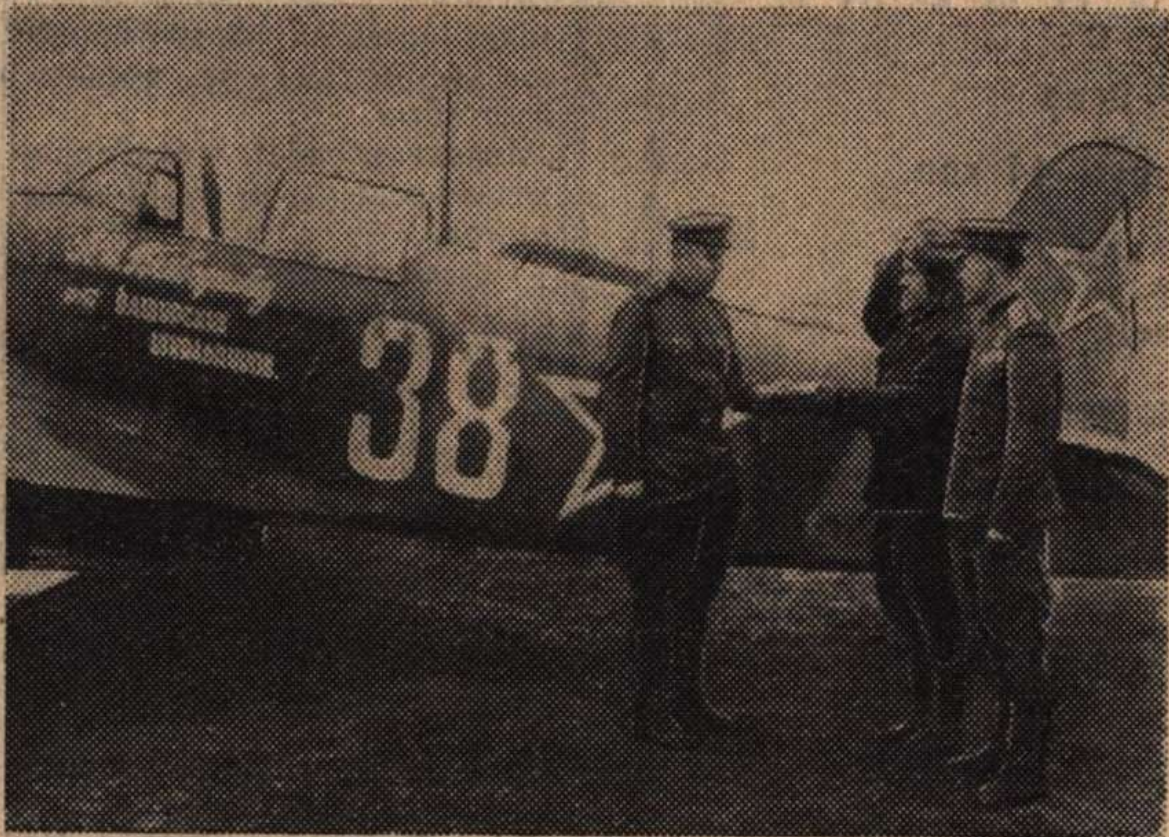
Вырезка из газеты «Огни коммунизма»