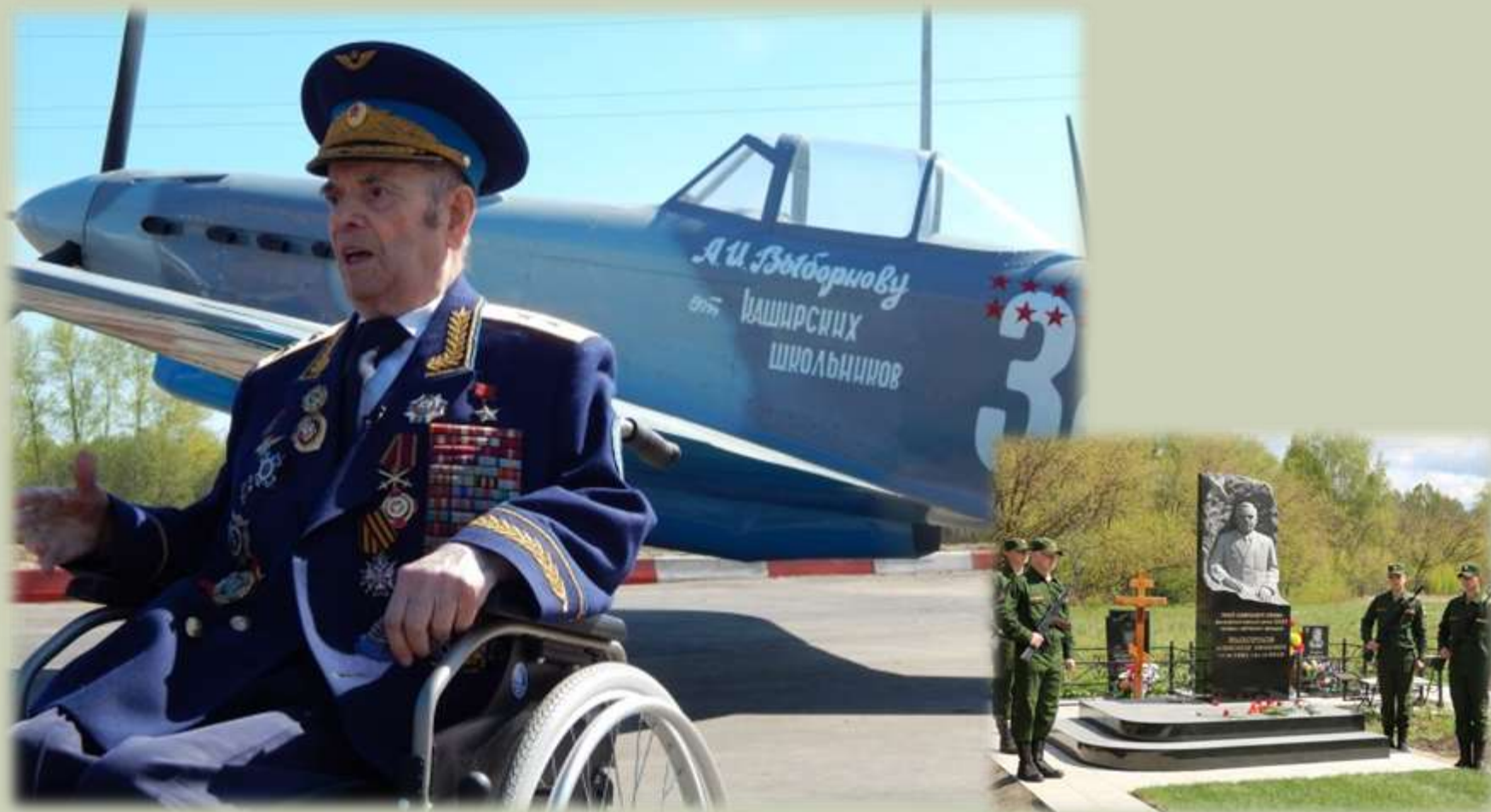
Похоронен на Аладинском кладбище